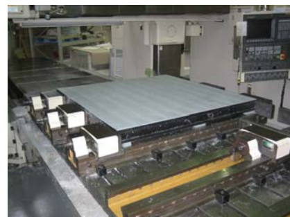
VB-30180 広幅口金取付け例