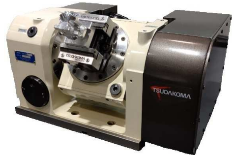
円テーブル装着例