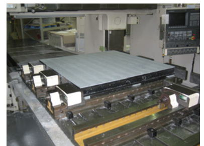
VB-30180 広幅口金取付け例